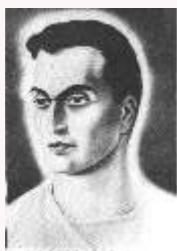
Emmanuel / Chico Xavier

As mensagens edificantes do Além, não se destinam apenas à expressão emocional, mas, acima de tudo, ao teu senso de filho de Deus, para que faças o inventário de tuas próprias realizações e te integres, de fato, na responsabilidade de viver diante do Senhor.