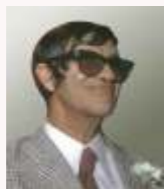
Francisco Cândido Xavier.

“O impresso é a forma de comunicação mais rápida e mais fácil e é por ele que os nossos Amigos da Vida Maior estão dialogando com a comunidade, socorrendo o maior número de pessoas contra suicídios, delitos, agressões, violências, conflitos inúteis e toda uma lista de infortúnios, no campo do Espírito”.